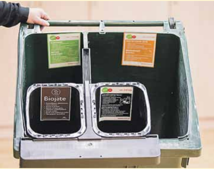
Nelilokeroastiaan voi tutustua Ekoroskin toimistossa Pietarsaaren Pirlissä.